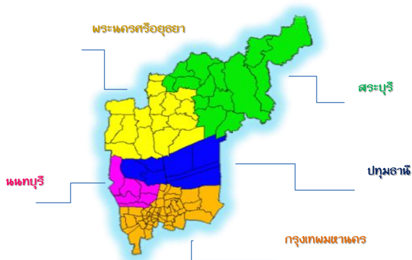
รูปภาพแสดงพื้นที่รับผิดชอบของสำนักงานศึกษาธิการภาค ๑

สำนักงานศึกษาธิการภาค ๑ ตั้งอยู่เลขที่ ๙ ถนนเทศบาลปทุม ตำบลบางปรอก อำเภอเมือง จังหวัดปทุมธานี รับผิดชอบพื้นที่กรุงเทพมหานคร จังหวัดนนทบุรี จังหวัดปทุมธานี จังหวัดพระนครศรีอยุธยา และจังหวัดสระบุรี